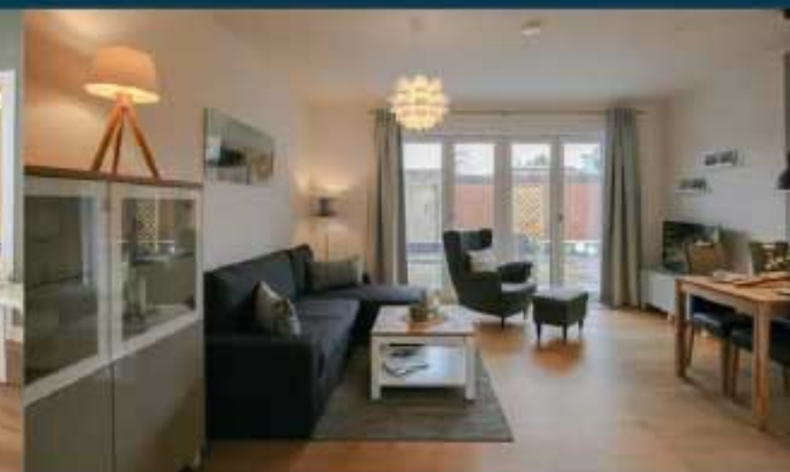
Ferienwohnung "Hafenquartier 54°"