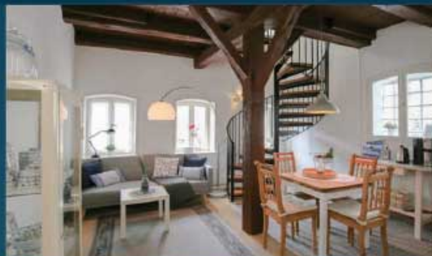
Altes Kontorhaus Steuerbord