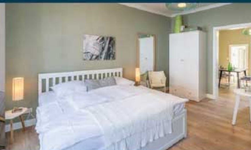
Ferienwohnung "Mok fast"